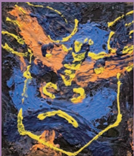
梁 4 「NO.1」