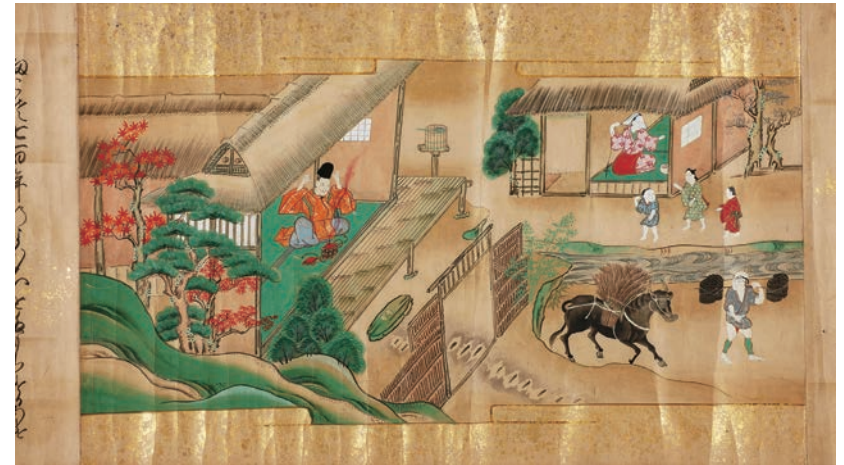
うら 『浦しま』 江戸中期頃写 卷子 1軸 縦31.6cm×全長929.1cm

室町から江戸期にかけて多数作られた短編の物語草子、お伽草子の一作品。古代の神仙思想を背景とする「浦島子伝」から派生したお伽草子の『浦島太郎』は、童謡で知られるストーリーと異なり、助けた亀が女と化して浦島太郎を竜宮城へと誘い、2人は夫婦の契りを結ぶ。故郷に帰り、玉手箱を開けてしまった浦島は、鶴になってしまったという。本文には玉手箱から「三筋の紫の雲」が立ち上ったとあるが、挿絵には不吉な赤い炎が描かれる。(糸汐里)