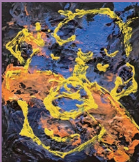
梁 5 「NO.2」