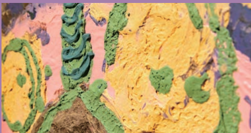
梁亜旋「FUNNY FACES」series 「NO.1」「NO.2」「NO.8」(2020年)