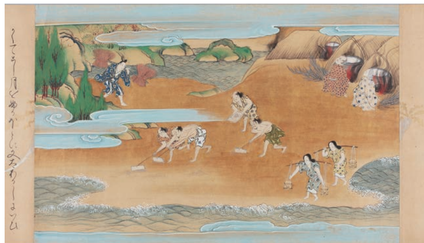
ぶんしょう 『ぶんしょう』 江戸前期頃写 卷子 3軸 縦34.2cm×全長上巻1576.3cm、中巻1277.2cm、下巻1500.5cm ひたちのくに かしまだいぬうじん だいくうじ ぶんしょう お伽草子。常陸国鹿島大明神の大宮司に仕える男が、塩焼きで富を得て文正と名乗る。授かった美しい娘は帝の后となって皇子を産み、文正は大納言まで出世したというめでた尽くしの物語。正月の読み初めにふさわしいとされ、嫁入り本としても好まれた。それゆえに多数の伝本が伝わる。本書も嫁入り本として制作された一本とみられ、華やかな下絵が施された詞書料紙をもち、人物の装束、調度に至るまで細密な挿絵を有する優品である。(糸汐里)