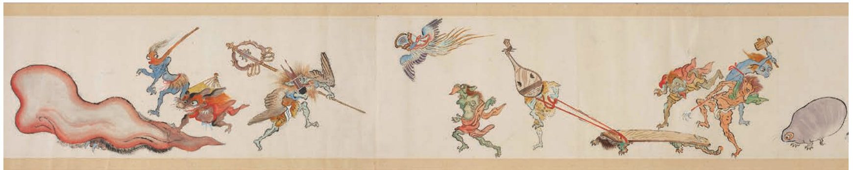
ひゃっき やぎょうず 『百鬼夜行図』