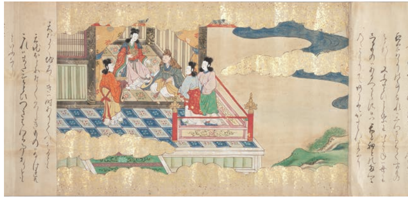
ちょうごんか しょう 『長恨哥の抄』 江戸前期写 卷子 3軸 縦32.9cm×全長 上巻1209.9cm、中巻1273.1cm、下巻1173.6cm

万治・寛文頃に刊行された絵入り版本『やうきひ物語』3巻3冊を元にした絵巻。版本の『やうきひ物語』は玄宗皇帝と楊貴妃の悲恋を詠んだ白楽天の詩文『長恨歌』の抄物(解説・注釈)で、仮名草子作者の浅井了意が版下を手がけているが、内容から作者である可能性も指摘される。『長恨歌』の抄物の絵巻は大阪大谷大学図書館蔵本など10点余りが知られている。本書は人物を大きく、容貌もふっくらと愛らしく描くという特徴がある。(糸汐里)